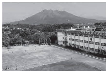
地域が先生とともに子どもを育てる

置し605件の相談に対応した。生徒指導上の問題や保護者対応、スクールロイヤー等の専門家の活用や警察、児童相談所等との連携に寄与して事案の深刻化の防止に効果を得ている。