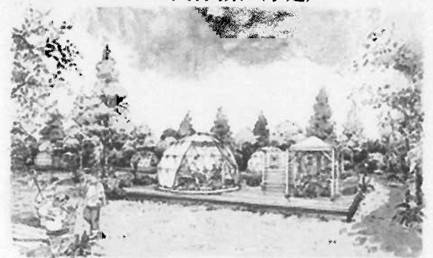
ドーム型テントタイプイメージ

グランピングとは「優雅な」「魅力的な」という意味の「glamorous」と「camping」を合わせた造語。アウトドアをリゾート感覚で快適に楽しむキャンプの新しいスタイルである。